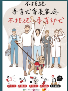
不拒絕導盲犬寄養家庭 不拒絕導盲幼犬