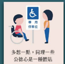
不占用身心障礙者 專用停車位