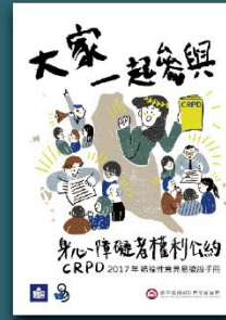
2017年CRPD 結論性意見易讀版手冊