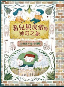
希兒與皮帝的神奇之旅 臺灣手語繪本