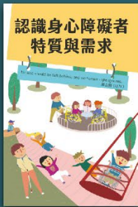
認識身心障礙者 特質與需求