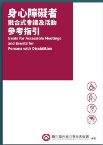
身心障礙者 融合式會議參考指引