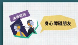
身心障礙者法律扶助專家