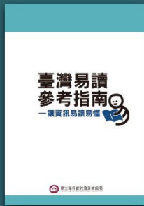
臺灣易讀參考指南 一讓資訊易讀易懂